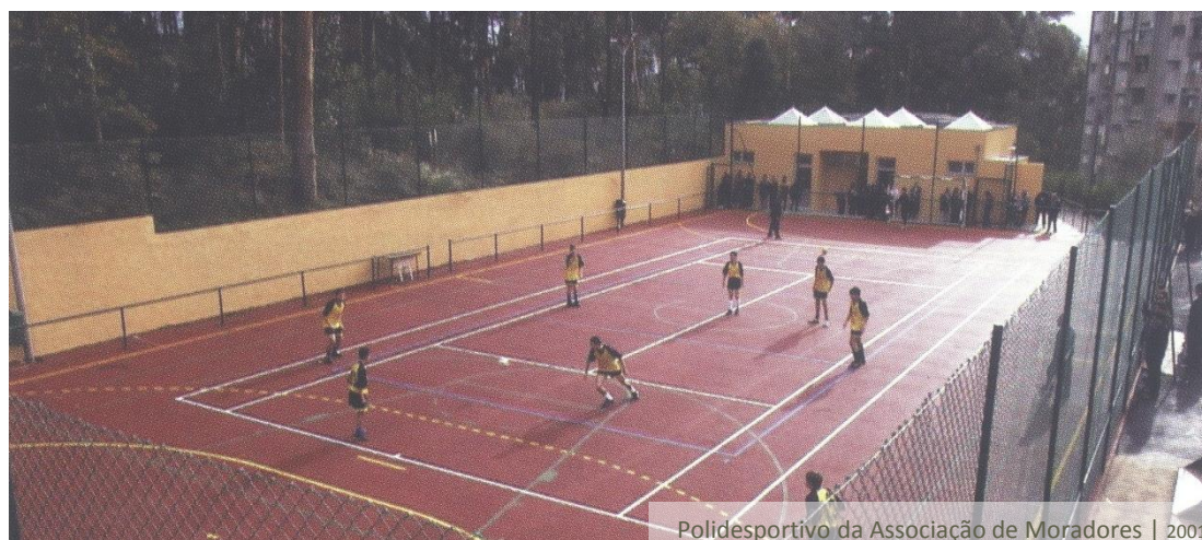
Polidesportivo da Associação de Moradores | 2001

Na senda desta aposta em equipamentos de relevo para a promoção da igualdade de oportunidades e da coesão social, a Câmara Municipal de Gaia construiu também o polidesportivo da sede da Associação de Moradores de Vila d' Este, na Rua de Salgueiro Maia, a mais emblemática da urbanização. O equipamento está dotado com balneários e espaço para a sede social e lugar de convívio da instituição. As linhas de apoio ao movimento associativo foram alargadas quando a autarquia avançou mesmo para a aquisição de diversas lojas existentes na urbanização, as quais foram cedidas para sede de outras associações locais.