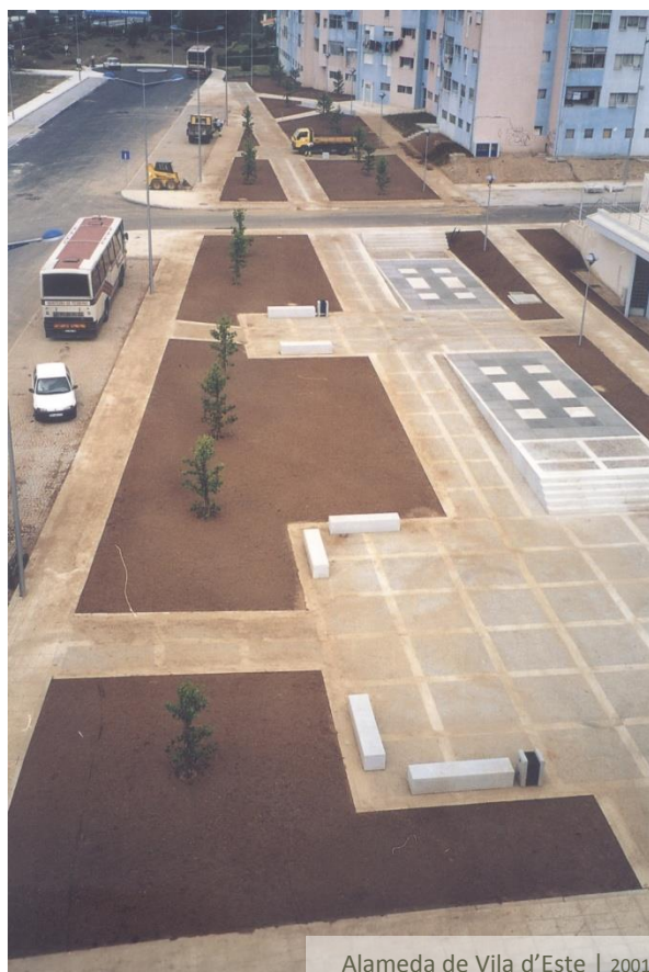
Alameda de Vila d' Este | 2001

A Alameda de Vila d' Este, construída na sequência da implementação dos novos equipamentos municipais, fundou a política de valorização dos espaços de usufruto público na urbanização e abriu novas oportunidades de convívio e partilha na comunidade.