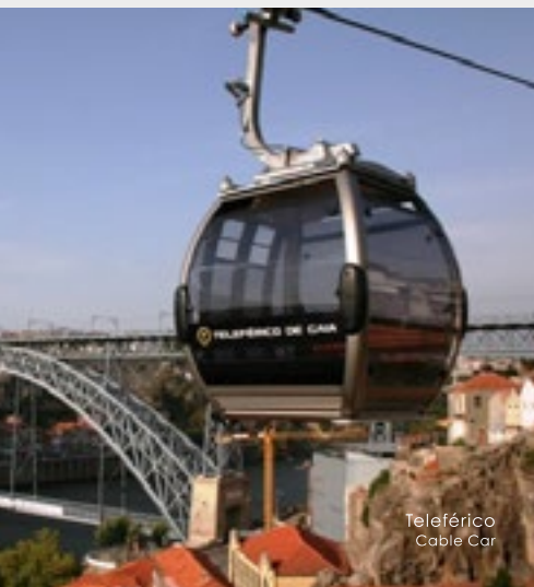
Teleférico Cable Car