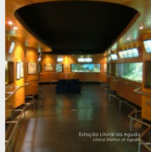
Estação Litoral da Aguda Litoral Station of Aguda