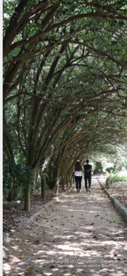
Parque Quinta do Conde das Devesas Quinta do Conde das Devesas Park