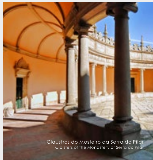
Claustros do Mosteiro da Serra do Pilar Cloisters of the Monastery of Serra do Pilar