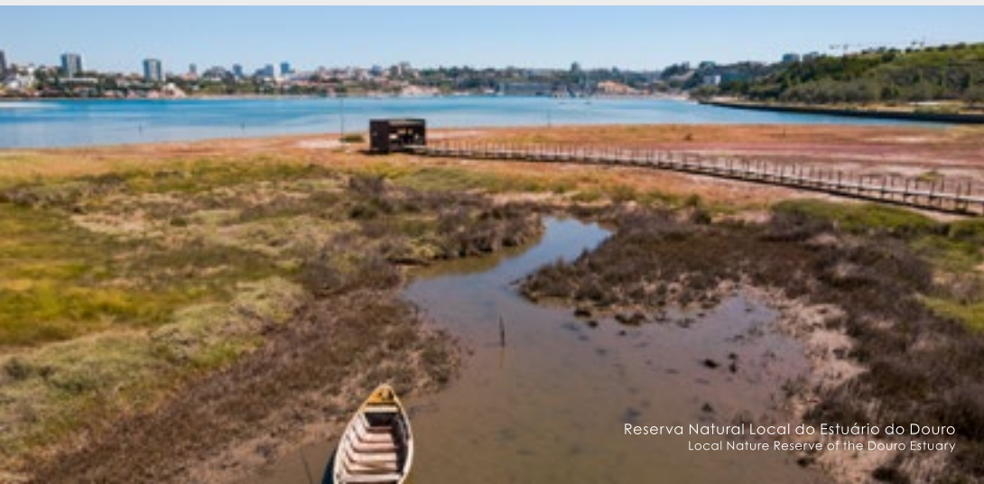
Reserva Natural Local do Estuário do Douro Local Nature Reserve of the Douro Estuary