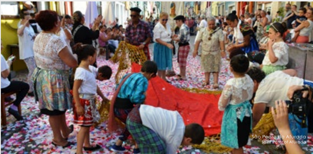
São Pedro da Afurada Saint Peter of Afurada