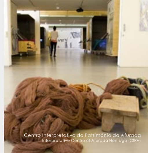
Centro Interpretativo do Património da Afurada Interpretative Centre of Afurada Heritage (CIPA)