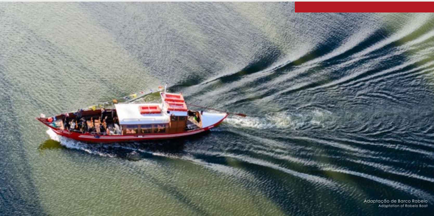
Adaptação de Barco Rabelo Adaptation of Rabelo Boat