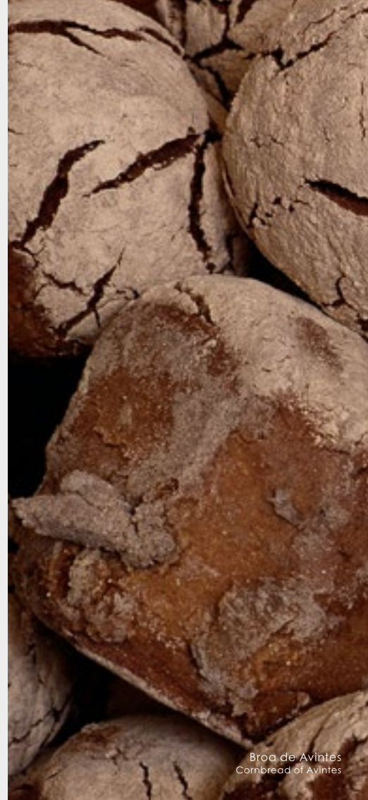
Broa de Avintes Cornbread of Avintes