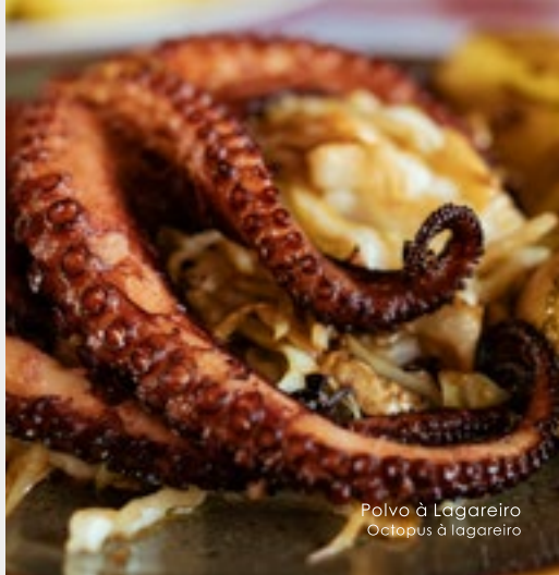
Polvo à Lagareiro Octopus à lagareiro