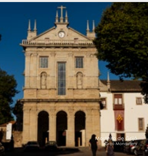
Mosteiro de Grijó Grijó Monastery