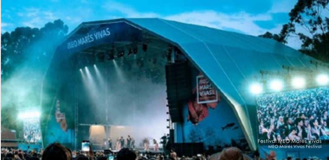
Festival MEIO Marés Vivas MEIO Marés Vivas Festival