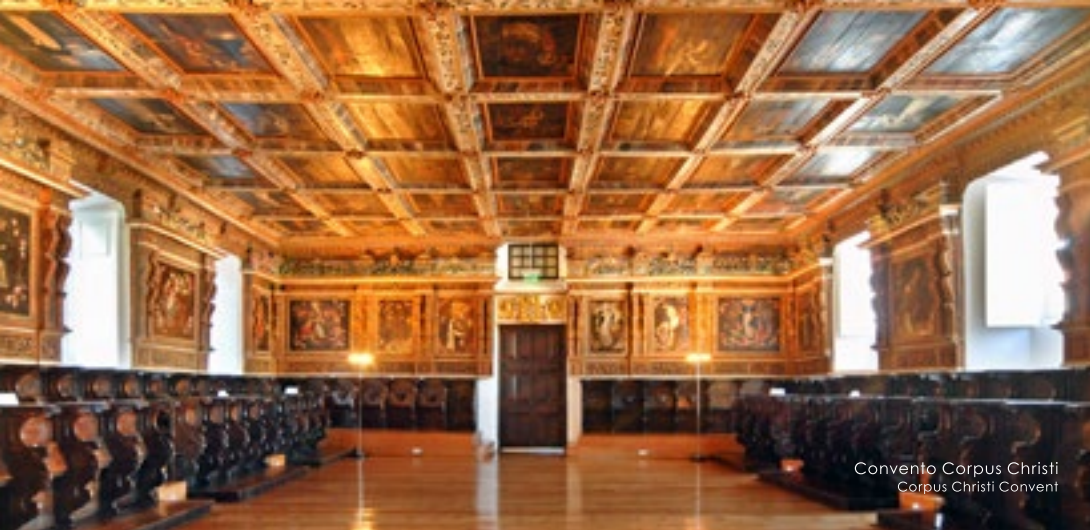
Convento Corpus Christi Corpus Christi Convent