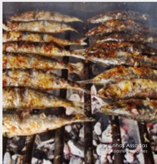
Sardinhas Assadas Roasted sardines