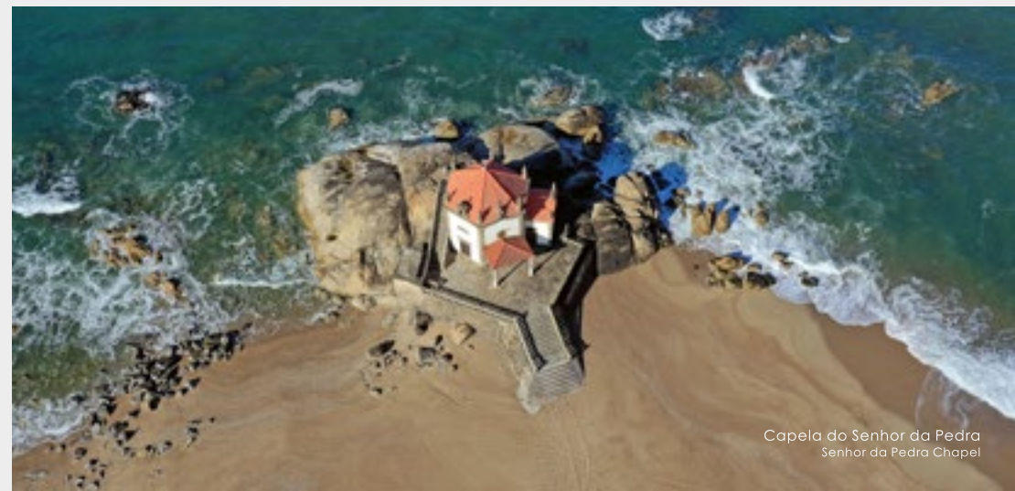
Capela do Senhor da Pedra Senhor da Pedra Chapel