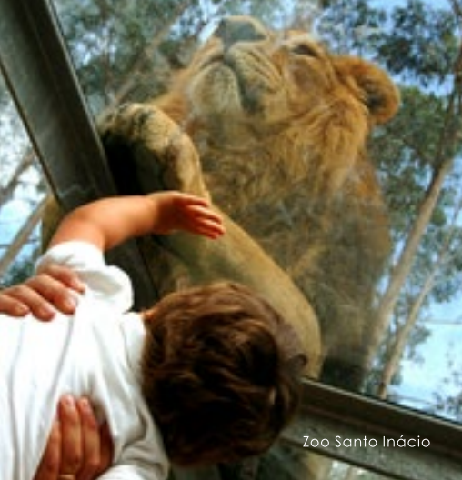
Zoo Santo Inácio