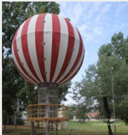
Parque da Lavandeira Lavandeira Park