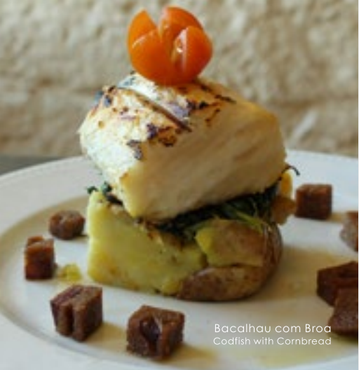
Bacalhau com Broa Codfish with Cornbread