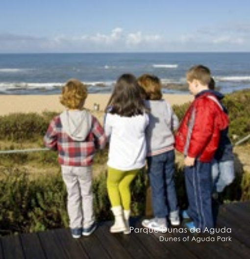
Parque Dunas da Aguda Dunes of Aguda Park