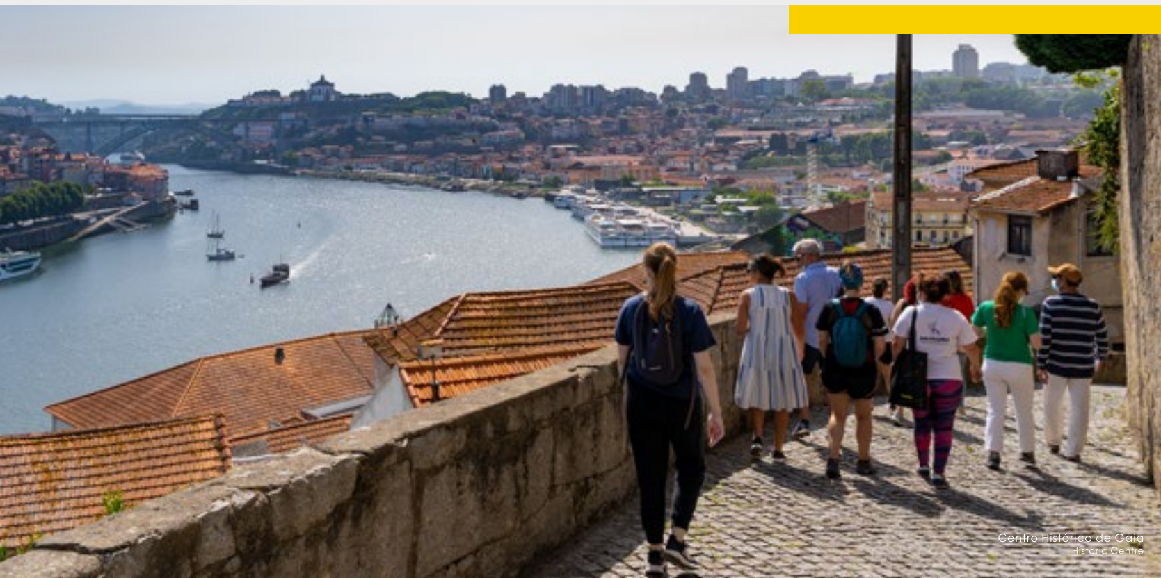
Centro Histórico de Gaia Historic Centre