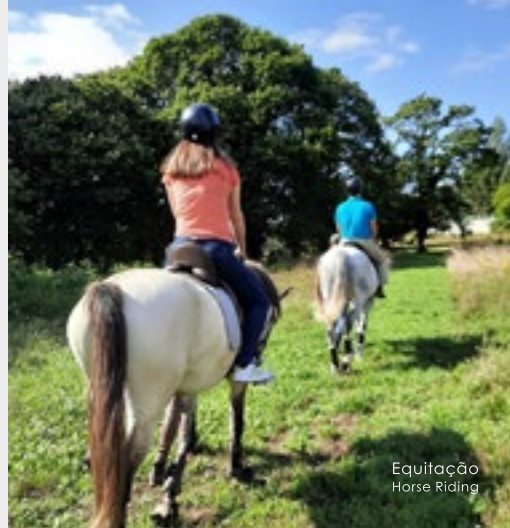
Equitação Horse Riding