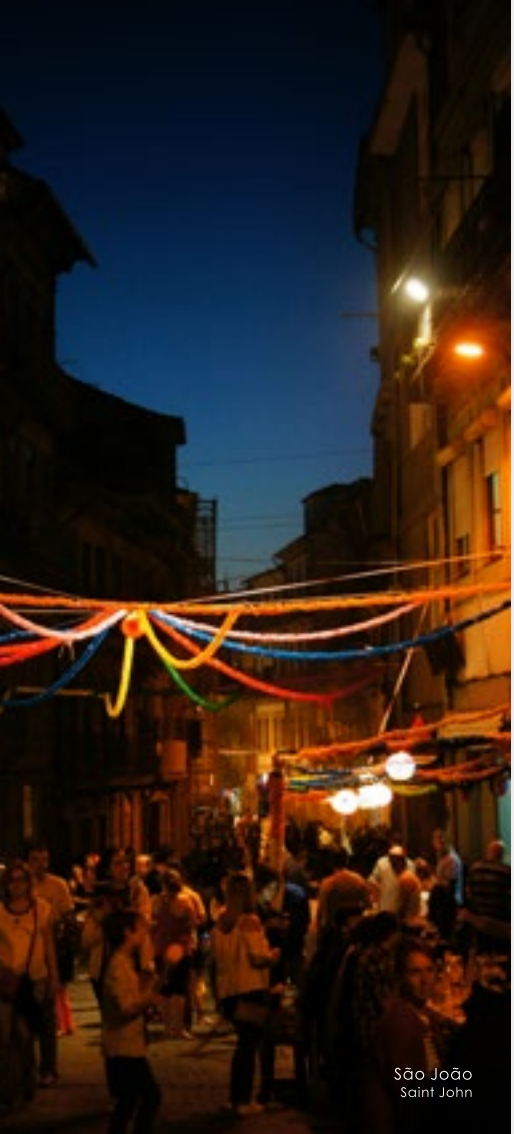
São João Saint John