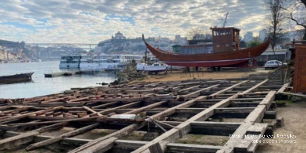
Estaleiro de Barcos Rabelos Rabelo Boats Shipyard