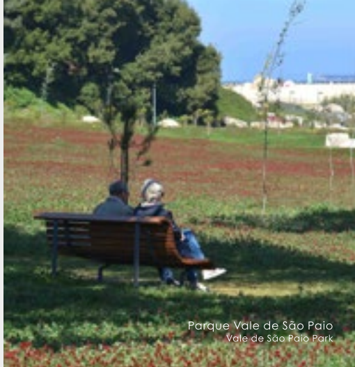
Parque Vale de São Paio Vale de São Paio Park