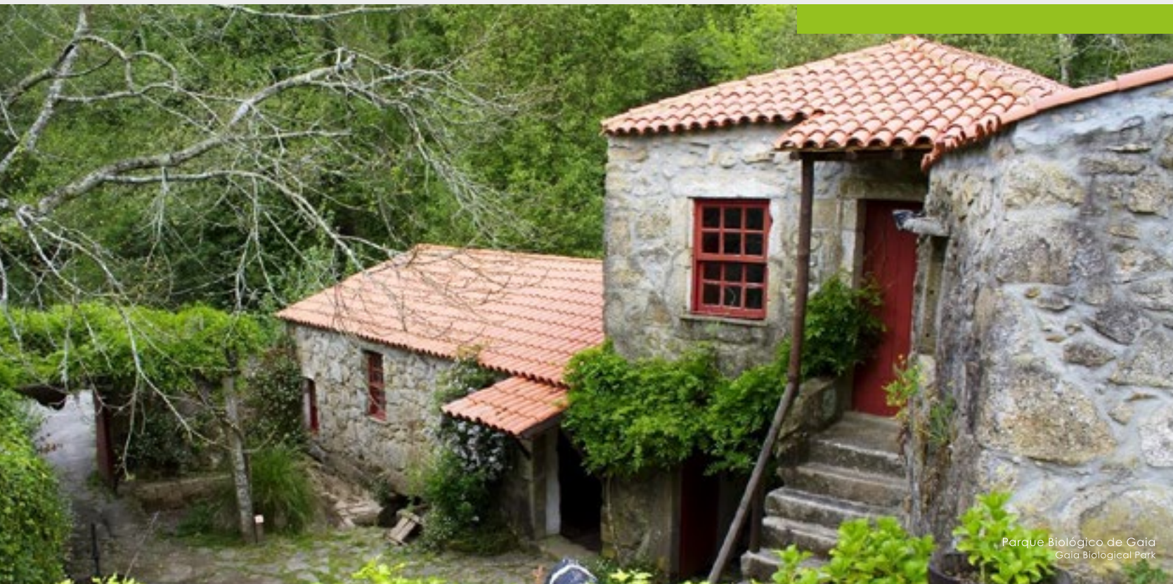
Parque Biológico de Gaia Gaia Biological Park