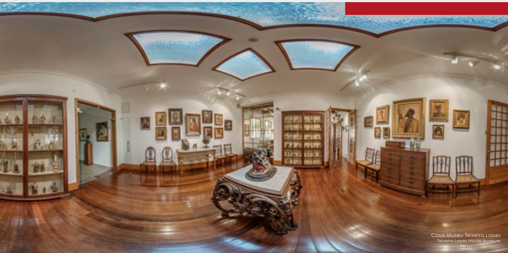
Casa-Museu Teixeira Lopes Teixeira Lopes House Museum