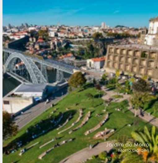
Jardim do Morro Morro Garden