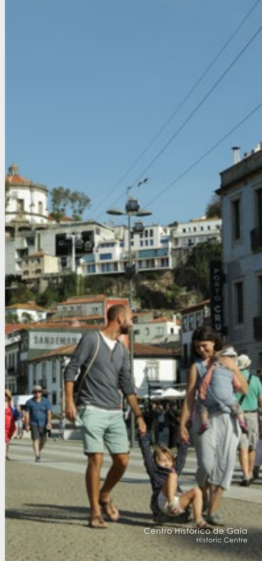
Centro Histórico de Gaia Historic Centre