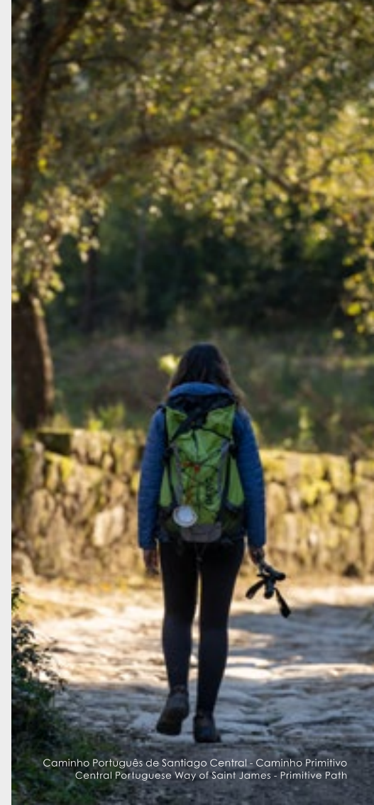
Caminho Português de Santiago Central - Caminho Primitivo Central Portuguese Way of Saint James - Primitive Path