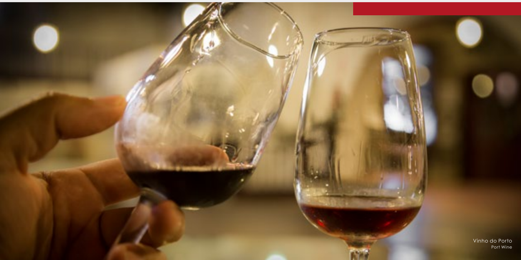
Vinho do Porto Port Wine