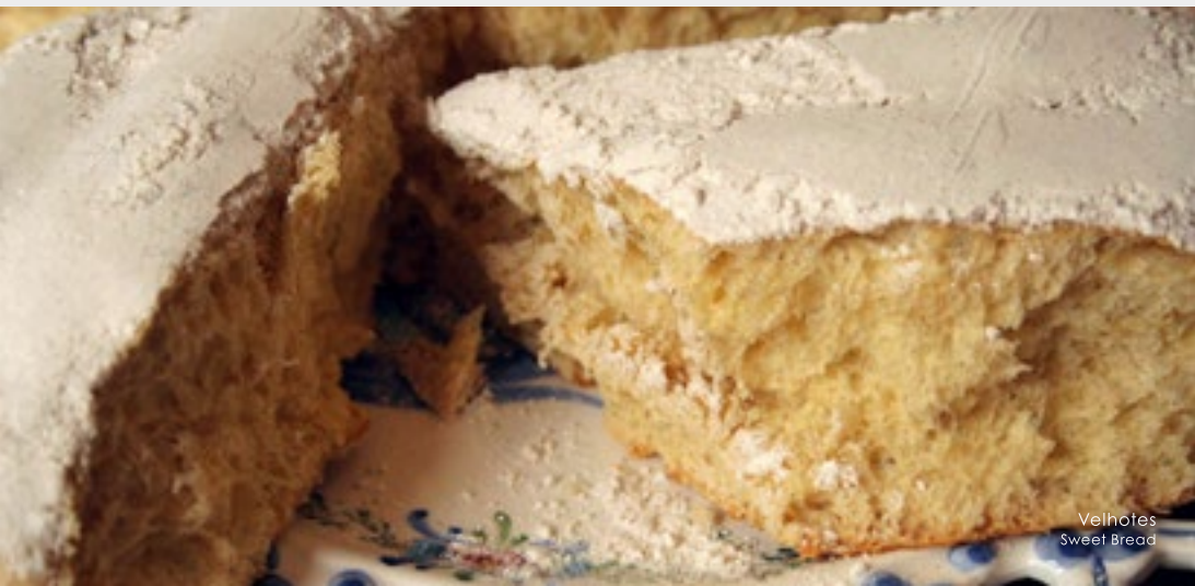
Velhotes Sweet Bread